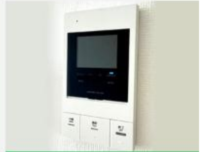
モニター付インターホン