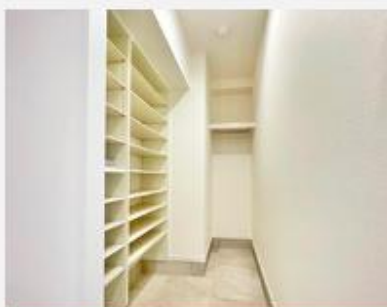
ウォークインシューズクローゼット